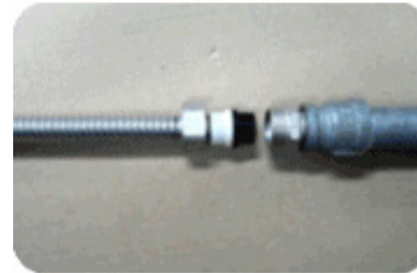
Step 6 : 피팅 조립하기

소켓의 테이퍼 나사부에 실링제(Sealant)를 바르고, 파이핑 시스템(T 또는 보일러 등)에 Crescent Wrench를 사용하여 높은 토크로 조인다.