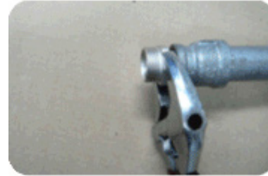
Step 5 : 소켓 체결하기

소켓의 테이퍼 나사부에 실링제(Sealant)를 바르고, 파이핑 시스템(T 또는 보일러 등)에 Crescent Wrench를 사용하여 높은 토크로 조인다.