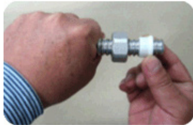
Step 3 : 전기 절연링 끼우기