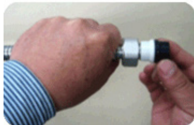
Step 4 : 글로브 패킹 끼우기