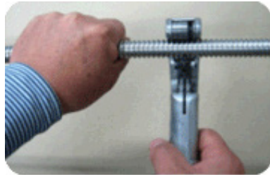
Step 1 : 튜브 자르기

튜브를 원하는 길이로 스테인리스 스틸 핸드 카터를 사용하여 튜브의 중심선에 대하여 직각으로 버(Burr)가 생기지 않도록 반듯하게 자른다.