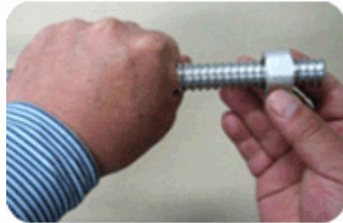
Step 2 : 유니온 너트 끼우기

튜브를 원하는 길이로 스테인리스 스틸 핸드 카터를 사용하여 튜브의 중심선에 대하여 직각으로 버(Burr)가 생기지 않도록 반듯하게 자른다.