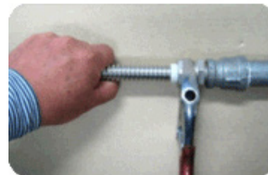
Step 7 : 유니온 너트 조이기

튜브, 전기 절연링, 그로브 패킹이 일체로 된 것을 소켓 내부의 테이퍼 홀이 삽입한다.